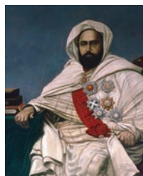
Emir ABD EL-KADER